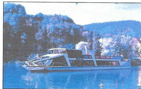
Schiffahrt auf dem Rhein

Ziel: Tössegg , Schiffahrt auf dem Rhein Ort wo die Töss in den Rhein mündet, Gemeinde Freienstein-Teufen ZH