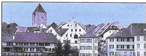
Das kleinste Aargauer Städtchen Kaiserstuhl