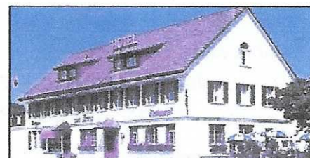
Restaurant Kreuz Kaiserstuhl

Einladung an: Mitglieder mit Partnerinnen/Partner und Freunde